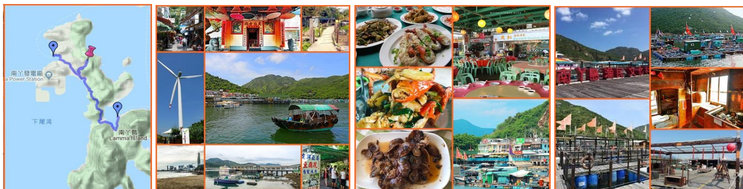
行程及圖片祇供參考